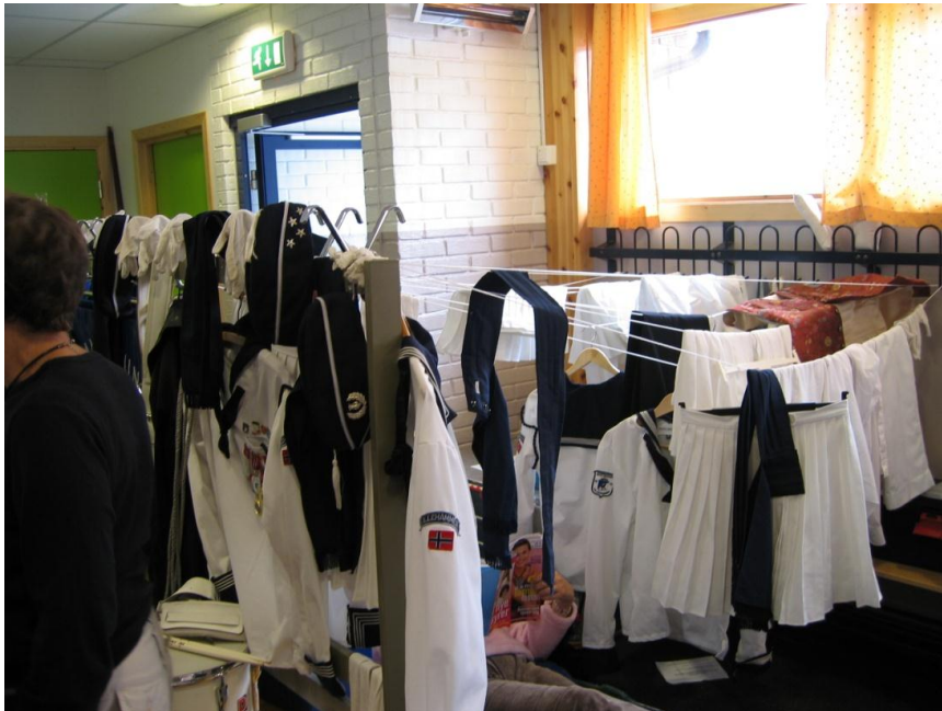
Tørking av klær etter åpning av festivalen

ble hver krik og krok brukt til tørking – og den påfølgende dag kunne alle stille opp i uniform som vanlig.