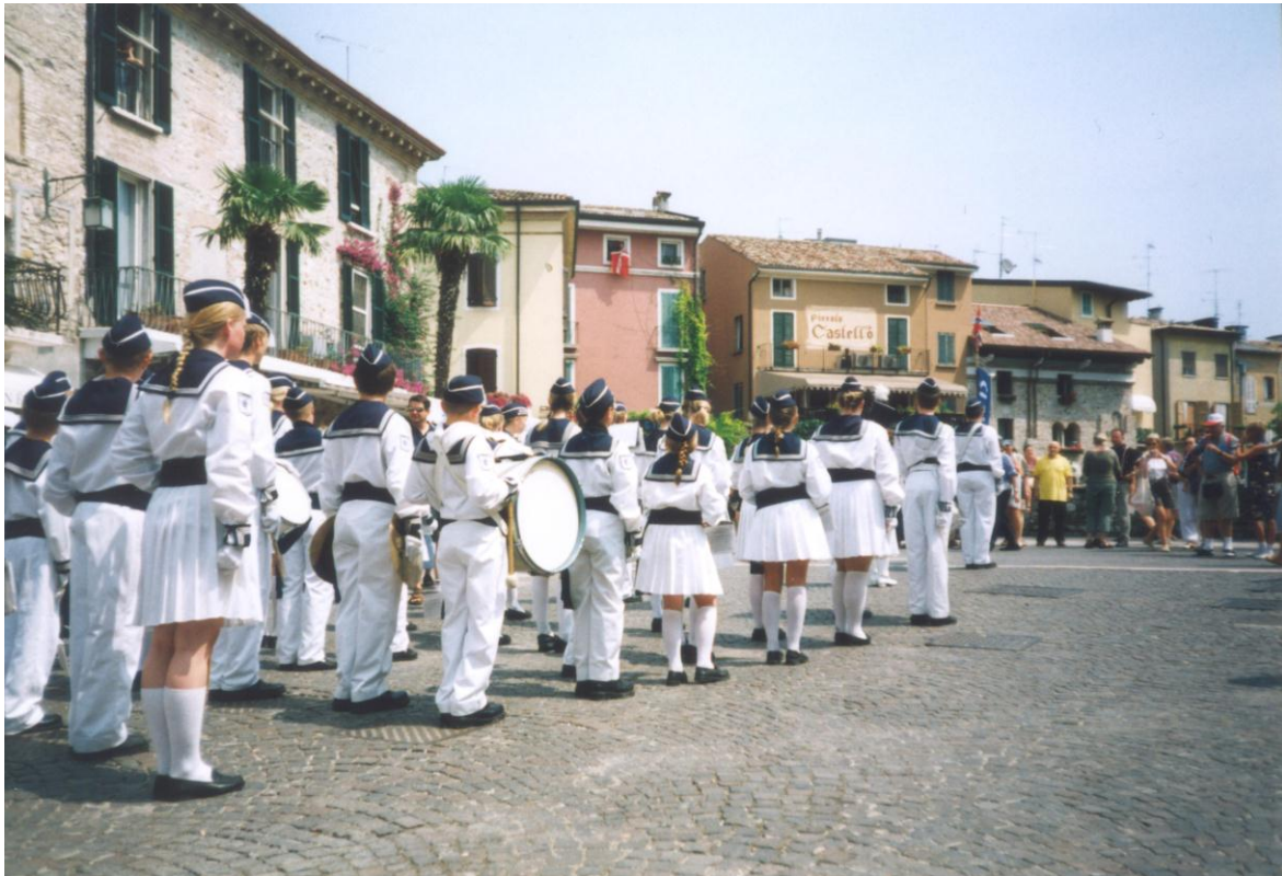
Da korpset spilte på Pizza Castello ved borgen, rullet et norsk flagg ut av et vindu.