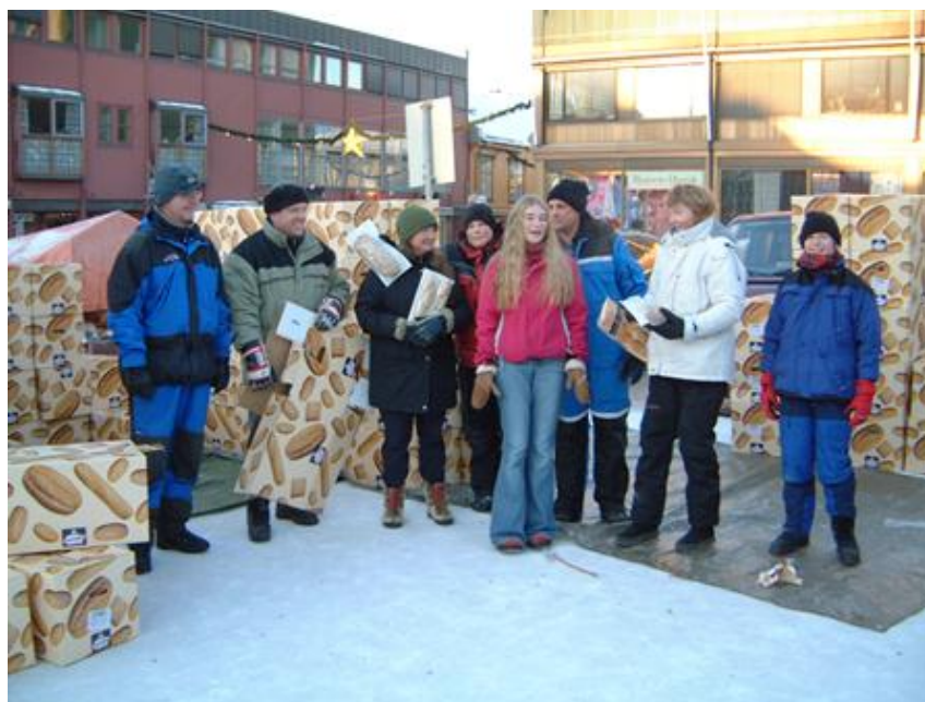
Brødutdeling på Lilletorget før jul i 2002

Foruten de vanlige inntektene har korpset hatt noen ekstra-dugnader for å skaffe penger i kassa. Brød-utdeling ga gode penger i reisekassa. En ny type vakuumpakket og delvis stekt brød skulle inn på markedet – og korpset stilte velvillig opp for å dele ut brød til byens befolkning. To lørdager før jul i 2002 delte vi ut 17400 brød(102 paller!!). Noen folk var nok litt skeptiske til hva denne gratis-utdelingen i byens gater var for noe. På Strandtorget ble det delt ut til folk idet de kjørte ut fra parkeringen. Når noen kjørte ut to ganger fra samme parkering, så skjønte vel de fleste at folk satte pris på å få brød gratis. Ingen oppgave for liten – ingen for stor var vel noe av korpsets motto! Vi ble betalt kr 35000,- for denne jobbene.