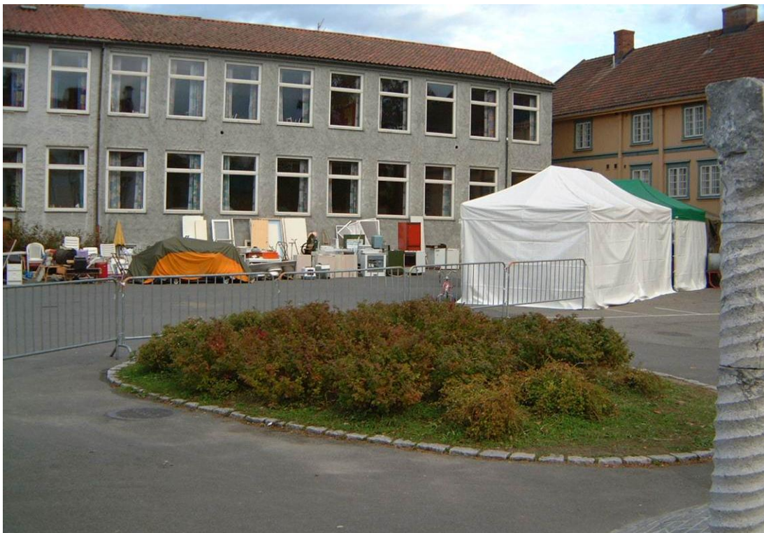
Loppemarked høst 2002: Siste loppemarked på Hammartun skole.