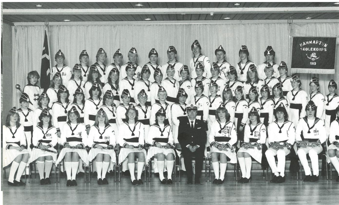
Hammartun Skolekorps 70 år.