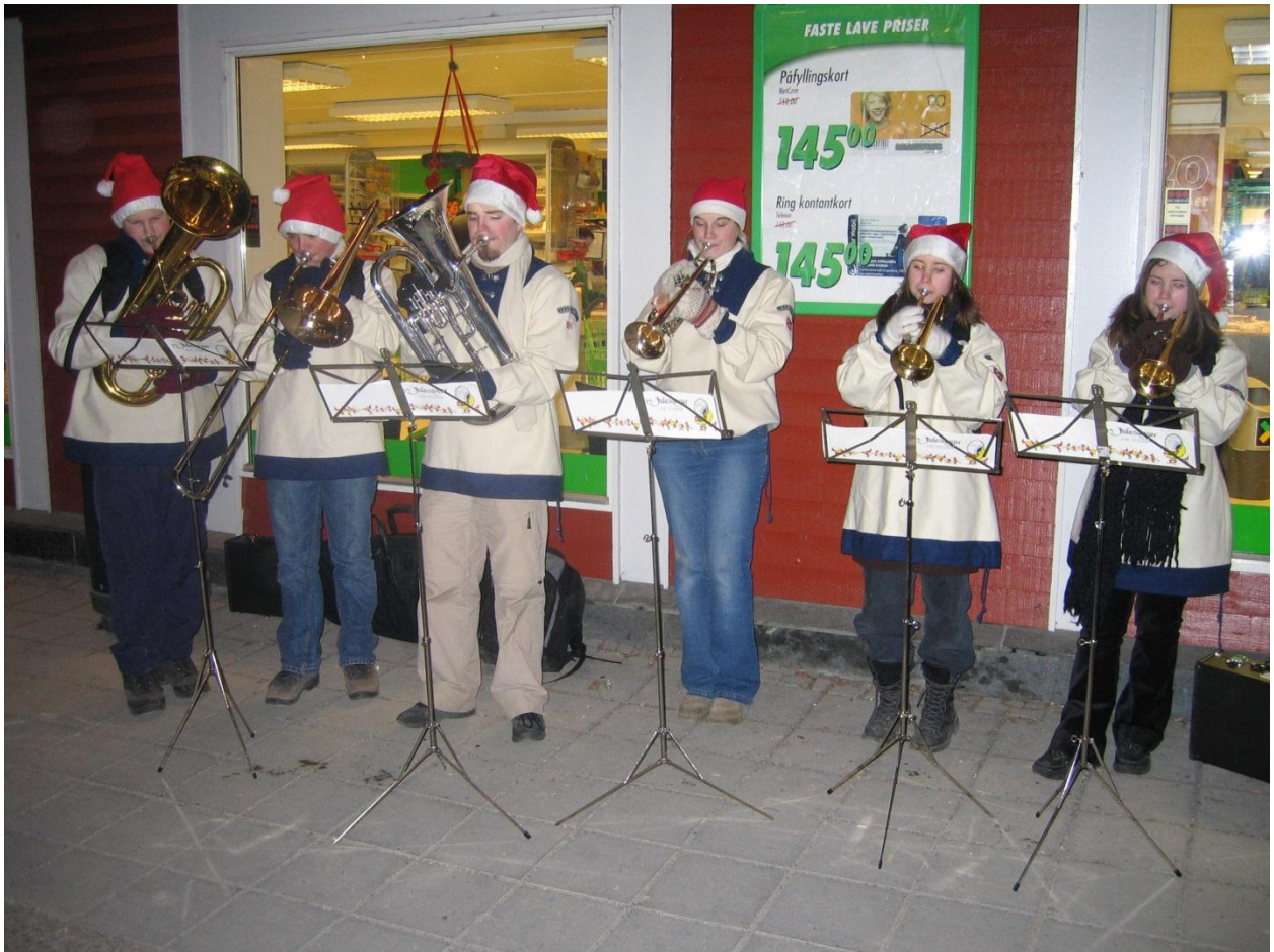
Julespilling i Storgata 2005