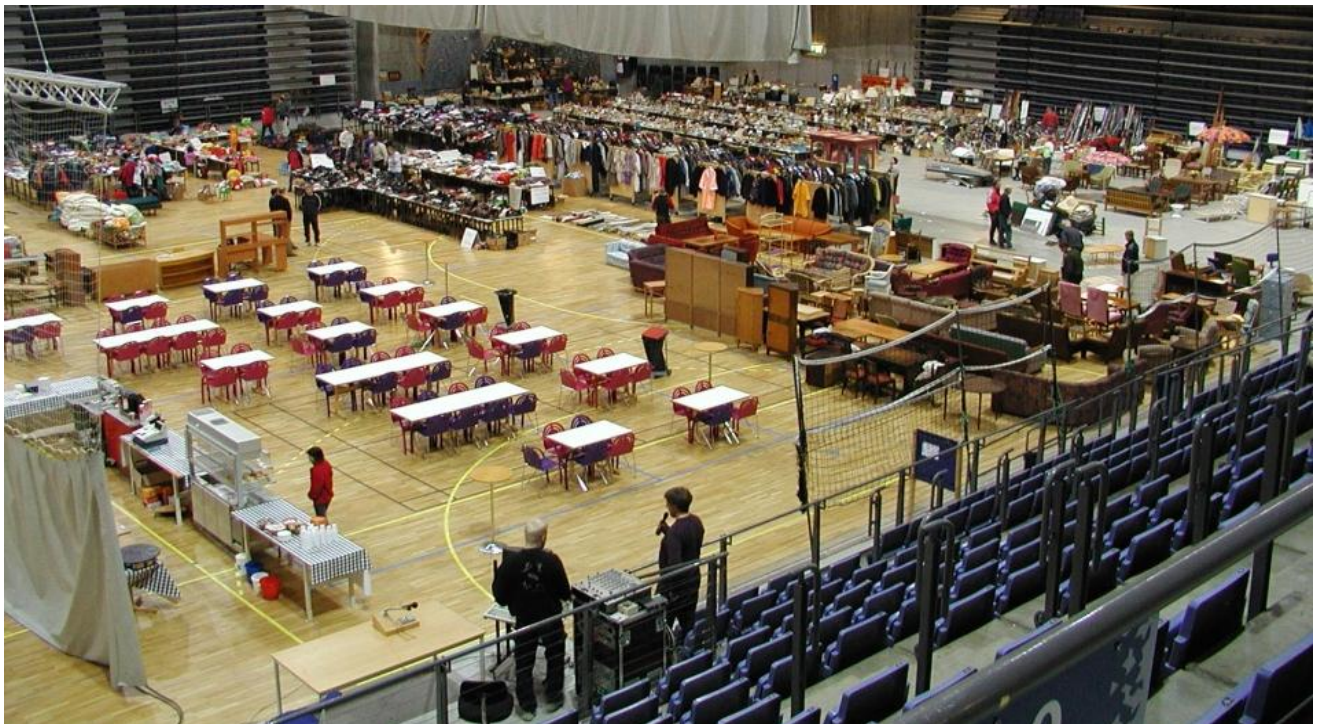
Loppemarked våren 2003: Første loppemarked i Håkons Hall, og søndre av hallen brukt. Alt kan foregå inne, god plass til alt, en flate og enkelt med transport rett inn i hallen.

Våren 2003 kunne vi kjøre loppene med bil inn i Håkons Hall – inngangen nord for Kristins Hall ”slukte” både små og store biler. Tilhengere overfylt med lopper kunne kjøre direkte inn til rett plass i hallen. Rigging av loppemarked fikk et helt nytt perspektiv. Det lå fortsatt en kjempedugnad bak fra mange foreldre for å få alt til å gå greit, men håndtering av lopper gikk så mye enklere. Glemte var tunge løfter for å plassere sofaer innerst i gangen på barneskolen.