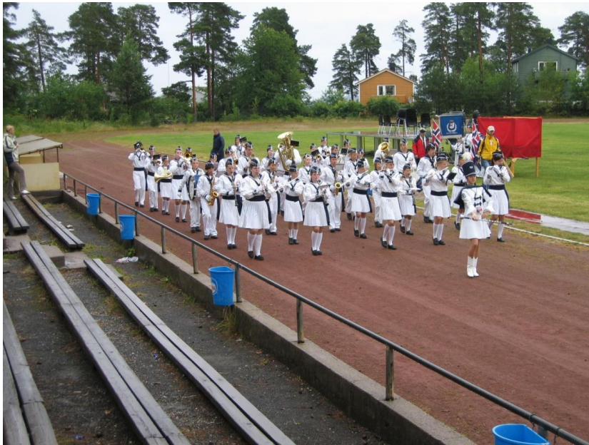
Dagen stilt korpset i rene og tørre uniformer til marsjkonkurransen på fuktig rød grus...

Hvite matrosdresser er krevende å holde i orden, men gjør seg veldig bra i gata. Mang en gang har det blitt vist til at det skjer noe med holdningene når uniformen kommer på.