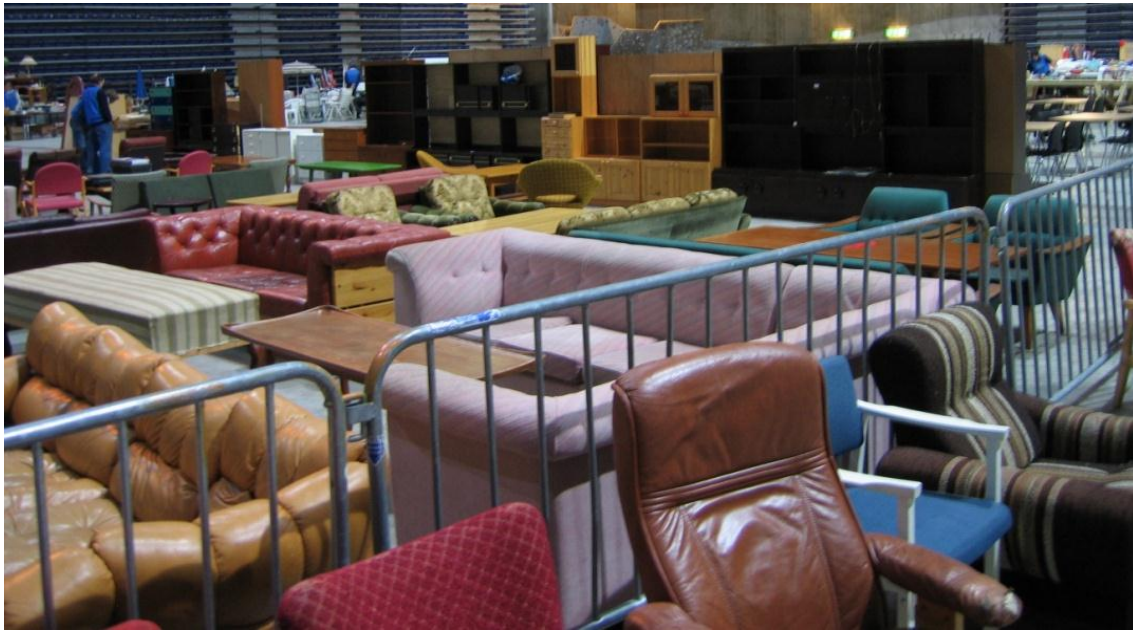
Loppemarked høsten 2004: Da ble hele hallen tatt i bruk. Her fra møbelavdelingen

Mange var spente før åpning av dørene for det første loppemarkedet i Håkons Hall. Hadde folk fått med seg flyttingen? Markedsføringsbudsjettet var som vanlig rimelig magert. Suksessen lot imidlertid ikke vente på seg – stinn brakke må være korrekt å si. Første loppemarkedet i nye omgivelser ga 25 % økning i omsetningen – sekssifret omsetning! De fleste skjønnte da at tiden for kalde, våte og krevende dager i skolelokalene var forbi. Litt vemodig sa noen, mens andre mente dette kun var et uttrykk for utvikling.