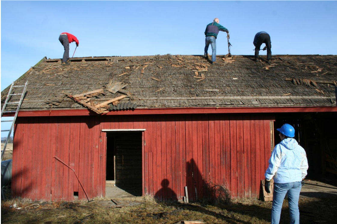
Riving av uthus på Stange

Ivrige foreldre har de siste årene vært kreative med sine dugnader. Det har vært demontering av kjøkken, som deretter er solgt på Finn.no. En gjeng brukte en helg med å rive et uthus i Hedmark. Lokaler har blitt ryddet, og ting fra dette har blitt solgt på Finn eller på loppemarkedet.