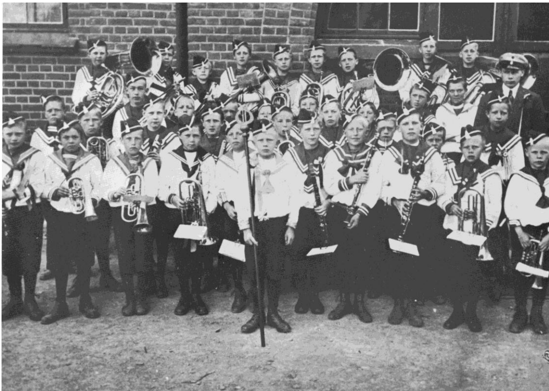
17. mai 1919