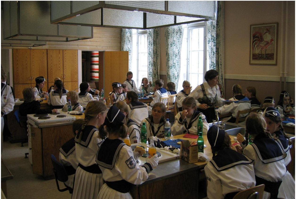
Matsservering 17. mai 2004